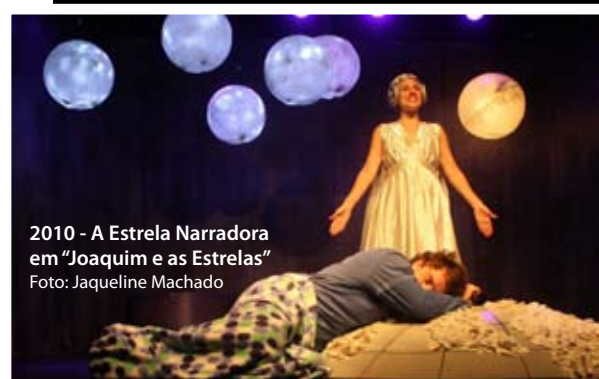
2010 - A Estrela Narradora em "Joaquim e as Estrelas"