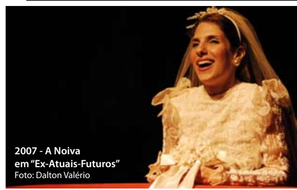
2007 - A Noiva em "Ex-Atuais-Futuros"

Participações nas novelas "Insensato Coração", "Tempos Modernos" e "Escrito nas Estrelas" da Rede Globo, "Prova de Amor" e "Luz do Sol" da Rede Record; série "Cilada" (Multishow) de Bruno Mazzeo; no cinema, além do curta-metragem "Os Sapos", de Clara Linhart; fez Flávia no longa-metragem "Mulheres do Brasil" de Malu de Martino e Mary-Mary no longa-metragem "Quase dois irmãos" de Lúcia Murat.